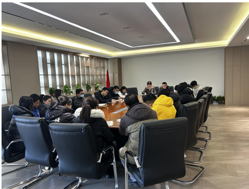
6 艺术类高考新形势下教学研讨

每年高考前夕，组织高三模拟考试。从考试试卷、考试时间、考场安排、座位号等均按照正规高考设置，有效提升学生信心、增加考场经验，也使高三教师有效把握高三在校生考前状态，明确最后复习安排，为高三学子高考前的冲刺，精准备战。文化课教研室召开高三家长会，形成家、校合力，加强高三学生的高考紧迫意识。